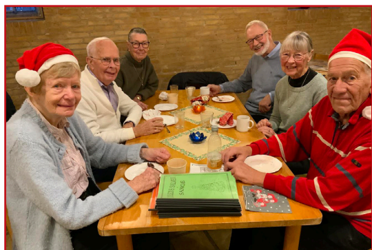
Banko og julehygge!