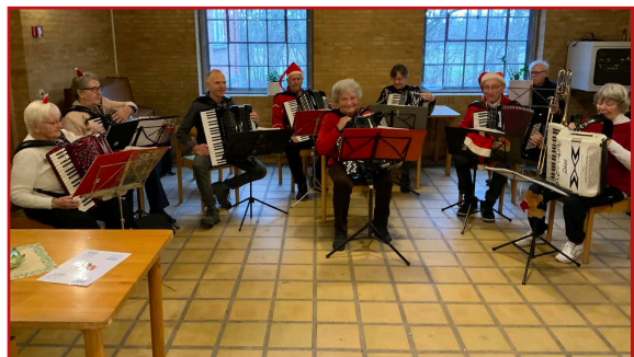
Julemusik og sang skulle der også til!