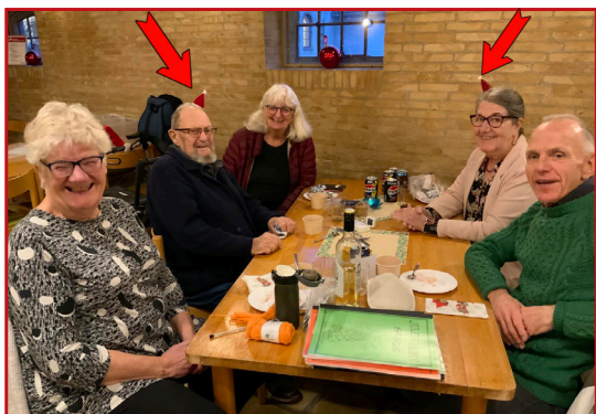
To små nissehuer kækt på sned....