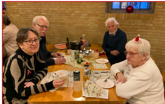
Så blev det tid til gløgg og æbleskiver