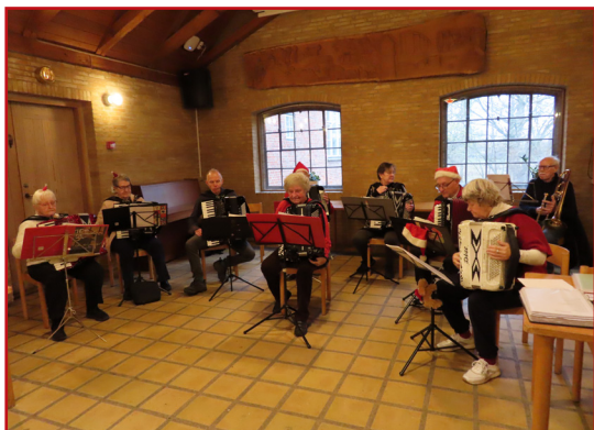
I år var der en trombone med

VHK julehygger igen i Kostalden fra kl. 11.15 lørdag den 5. december 2026